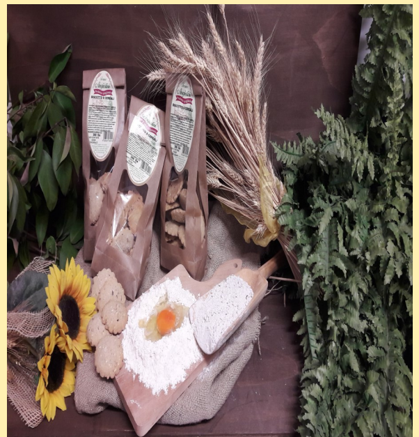
BISCOTTO CON 8 CEREALI CONFEZIONE DA 300gr