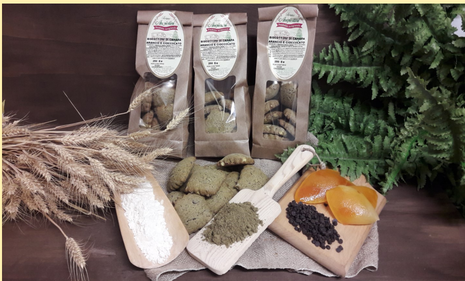
BISCOTTONI DI FARINA DI CANAPA, CIOCCOLATO E ARANCIA CANDITA CONFEZIONE DA 250gr