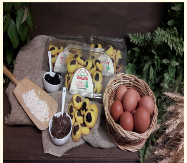
FIORI DI RISO DI FARINA DI RISO CON CIOCCOLATA E MARMELLATA DI FRUTTI DI BOSCO Confezione da 250gr