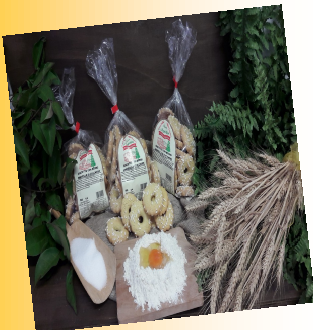
BUCO CON ZUCCHERO IN GRANELLA