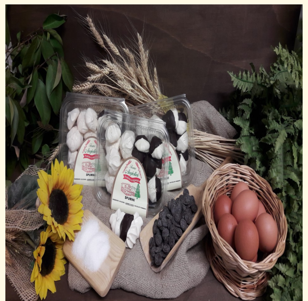
SPUMINI GLASSATI AL CIOCCOLATO Confezione da 100g