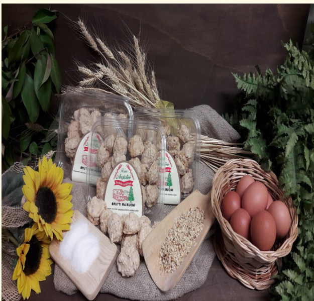
BRUTTI MA BUONI CON GRANELLA DI NOCCIOLE Confezione da 150gr