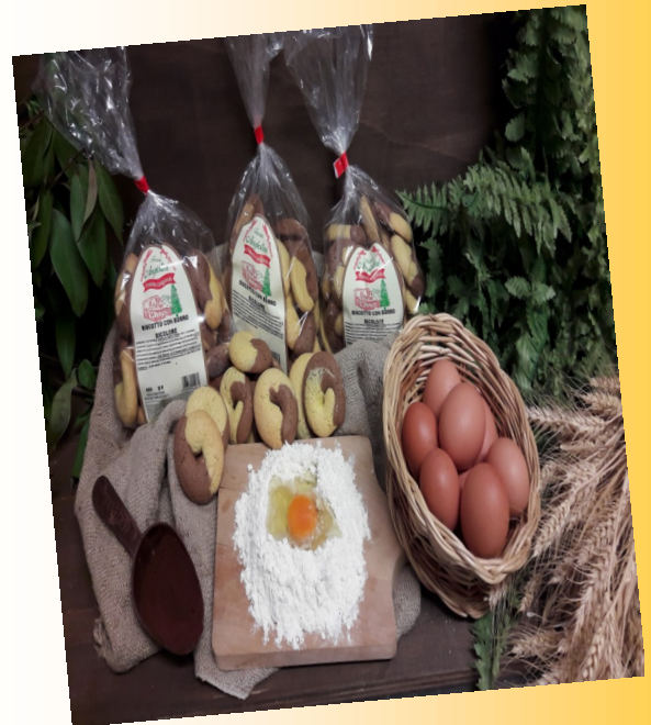
BICOLORE AL CACAO