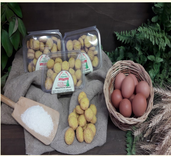
BISCOTTI DI FARINA DI COCCO Confezione da 250gr