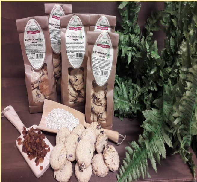
BISCOTTI CON FIOCCHI DI AVENA E UVETTA CONFEZIONE DA 300gr