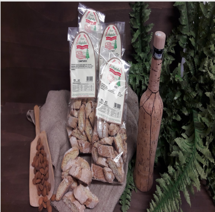
CANTUCCI CON MANDORLE Confezione da 250gr