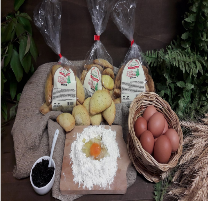
RAVIOLE CON MARMELLATA DI PRUGNA Confezione da 500gr