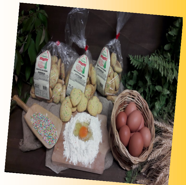
CUORE CON MOMPARIGLIA COLORATA