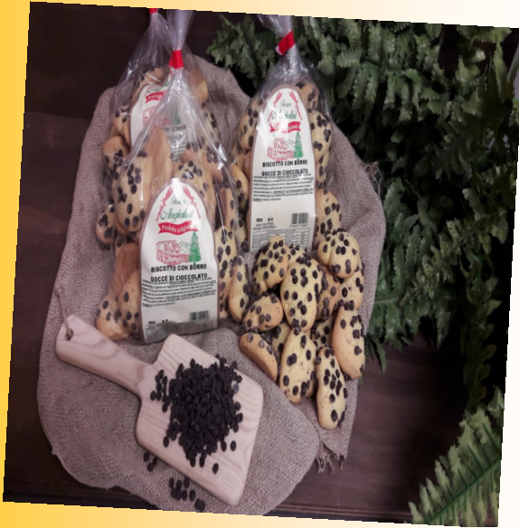
CUORI CON GOCCE DI CIOCCOLATO